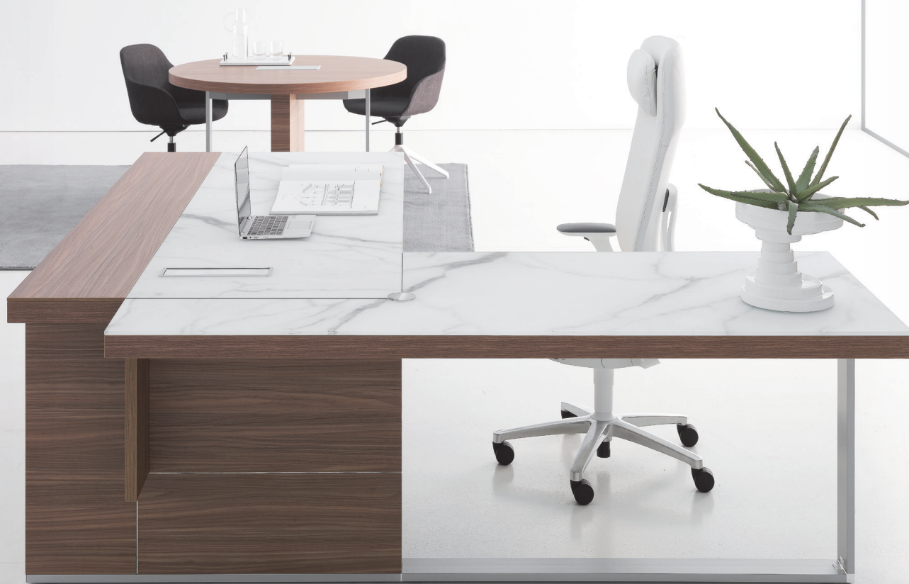
DV913 Vigo - design Baldanzi & Novelli